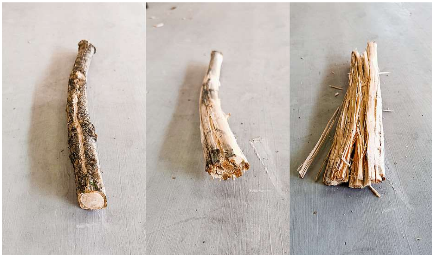
Abbildung 1: Beispielhafte Darstellung der Zerspreisselung eines Astabschnitts.

neuartiger Holzwerkstoff mit Einsatz von langen Spreisseln (Strands), ähnlich dem OSB, jedoch mit verbesserten Eigenschaften zur Substitution von Holzlamellen in Brettsperrholz (Abbildung 1). Dazu sollen qualitativ ungünstige Holzsortimente zu hochwertigen Bauprodukten verarbeitet werden, indem das Holz gequetscht wird. Die Idee: Wird das Holz gequetscht statt geschnitten, trennen sich die Faserbündel entlang der Holzstruktur und behalten ihre natürliche Festigkeit. Bei einem schneidenden Prozess werden die Fasern hingegen durchtrennt und verlieren einen Teil ihrer Festigkeit. Der Quetschvorgang bietet entsprechend einige Vorteile. Es können krumme und dünne Holzsortimente verwendet werden und nicht nur gerades Stammholz mit Mindestdurchmesser. Die Holzausbeute liegt dementsprechend bei fast 100 Prozent, einzig die Rinde kann nicht in der Platte mitverwendet werden. Die so erzeugten Spreissel haben deutlich bessere Eigenschaften als vergleichbare OSB-Strands.