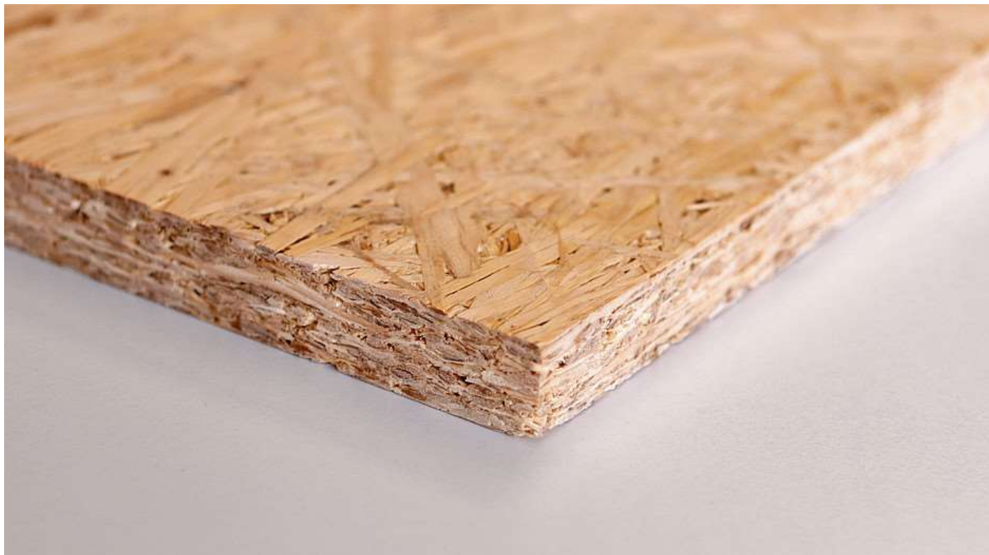
Abbildung 3: Musterplatte im Labor hergestellt.

bereits umfassendes Wissen zusammengetragen aus vorherigen Projekten weltweit und aus eigenen Versuchen. Auch konnten erste Platten im Composite Lab am BFH-Standort Solothurnstrasse in Biel mit zur Verfügung gestelltem Material hergestellt werden (Abbildung 3). Das Forschungsteam des Instituts für Intelligente Industrielle Systeme I3S hat währenddessen erste Konzepte erstellt und arbeitet derzeit an der Maschinenentwicklung. Parallel dazu führt das Team des IWH erste Quetschversuche auf einer gebrauchten Kleinmaschine durch; diese Maschine wurde ursprünglich für das Walzen von Metall gebaut. Sie wurde angeschafft, um relevantes Wissen für die Maschinenentwicklung zu generieren. Dabei sollen vor allem die Auswirkung der Geometrie der Walze, deren Oberflächenstruktur (Zähne, Rillen, Perforationen usw.) sowie Einflüsse aus dem Rohmaterial auf die Spreisselherstellung untersucht werden.